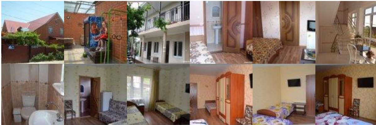
Фото гостиницы «Наталья»:

Расположение: посёлок расположен в 8-ми километрах от г. Геленджика, на побережье Цемесской бухты в окружении гор и сосен. Недалеко расположен рынок, набережная, кафе, бары, рестораны. На пляже водные велосипеды, катание на катерах и бананах, экскурсионное обслуживание. В поселке находится аквапарк Надежда. Живописная природа, кристально чистая вода, мелкая удобная галька – основные достоинства посёлка Кабардинка. Транспортное сообщение с Геленджиком регулярное – городским транспортом или маршрутным такси (15 мин.)