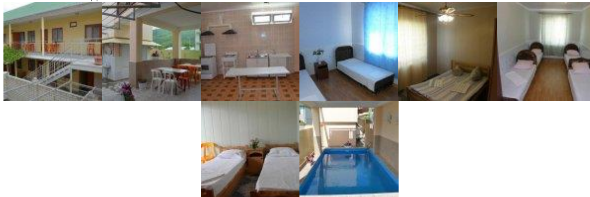
Фото гостевого дома:

Расположение: Частный гостевой дом расположен в центральной части курортного поселка Кабардинка на улице Дообская.