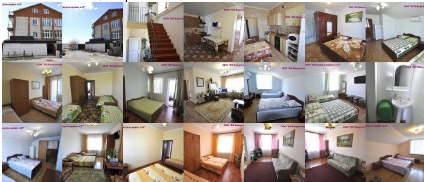
Фото гостиницы «Мария»:

Расположение: частная гостиница находится в районе Тонкого Мыса 250 м. от моря.