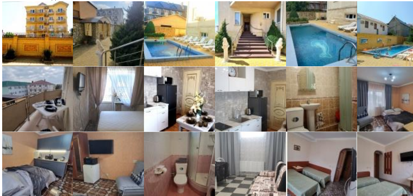
Фото гостевого дома "ЕлизАна":

Расположение: Гостевой дом "ЕлизАна" расположен в курортном поселке Витязево. Это современное 4-х этажное здание с уютными комфортабельными 1-но и 2-х,3-х местными номерами с балконами. В каждом номере находятся сплит-система, телевизор, холодильник, душевая кабина и санузел. Имеется сауна для желающих жаркие дни отдыха сделать еще жарче. Общей кухни нет.